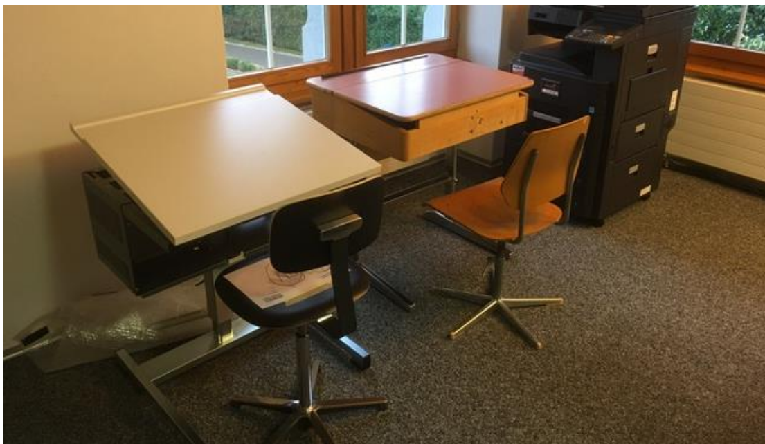
Abb. 6: Das alte und das neue Schülermobiliar im Vergleich

Aufgrund der heute bekannten Zahlen der S&S ist eine Anschaffung von 250 Pult-Stuhl-Kombinationen sinnvoll. Mit dieser Anzahl stehen auch noch einige Pulte und Stühle als Reserve in den nächsten rund 25 Jahren zur Verfügung. Die Arbeitsgruppe der OS hat dementsprechend bei der Firma embu-Werke eine Richtofferte für die Anschaffung von 250 Pulten mit Stühlen verlangt. Auf den Ersatz der Lehrerpulte wird vorerst verzichtet.