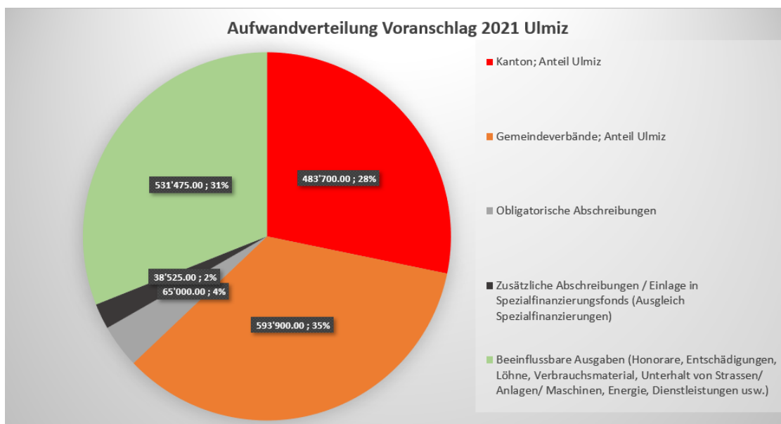
Abb. 2: Grafik Aufwandverteilung Voranschlag 2021

Die nachstehende Grafik zeigt, dass 69% aller Aufwände durch den Kanton, durch Gemeindeverbände oder durch Abschreibungen vorgegeben werden.